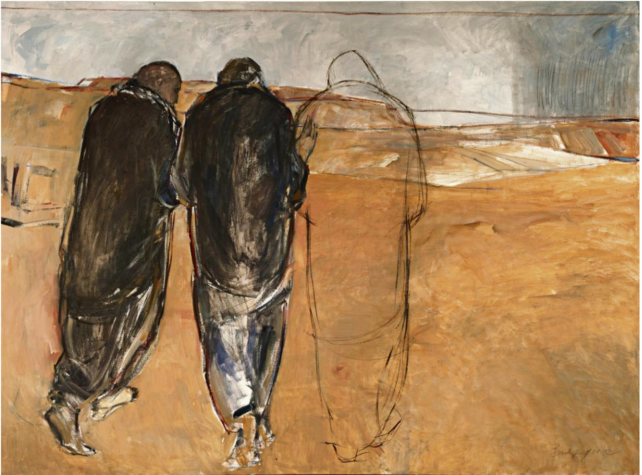
Schilderij 'Op weg naar Emmaus' van Janet Brooks-Gerloff.